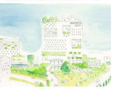
(図) 新たなまちづくりのイメージ