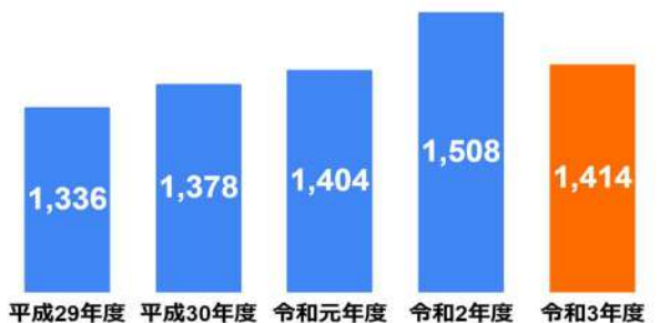
当初予算額 推移（億円）