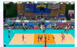
「観るスポーツ」の一つ バレーボール パナソニックパナサーズ

スポーツによる地域の活性化に つなげる取り組みについて スポーツの力をまちのチカラに！ 「観るスポーツ」を市民とともに！