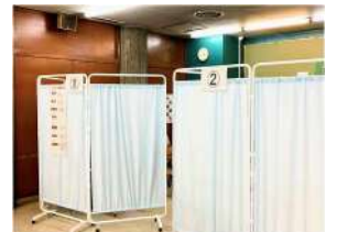
【ワクチン接種】常設の集団接種会場となる市民会館