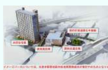
光善寺駅前再開発 計画イメージ