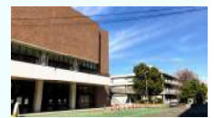
「④街区」市民会館 大ホールなどの跡地

④街区は、魅力ある市駅周辺再 整備を実現して行く上で中核 となる重要なエリアであると 認識している。枚方市駅前の 大空間を創出し、広域中心拠点としての 魅力を 高め、市内外からさまざまな人やモノが集い交 流する「まち」の実現に向けて取り組んでいく。