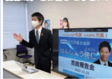
11月15日 市政報告会 【パナソニック社内（オンライン）】