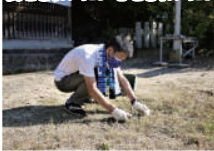
10月15日 OB会の皆様と神社清掃活動 【蹉跎神社】