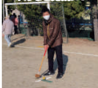
12月4日 地域の皆様とグラウン ドゴルフ大会【小倉小学校】