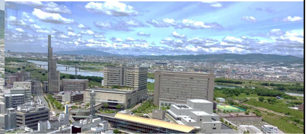
6月11日 カンデオホテルズ大阪枚方のスカイSPAからの眺望